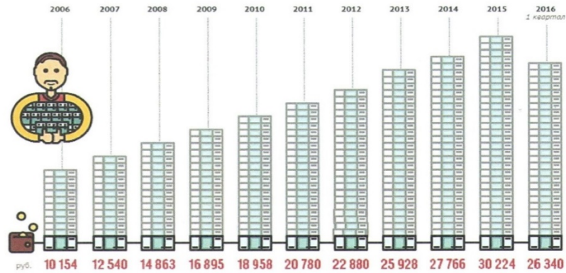
СРЕДНЕДУШЕВЫЕ ДЕНЕЖНЫЕ ДОХОДЫ ПО СУБЪЕКТАМ РОССИЙСКОЙ ФЕДЕРАЦИИ 2015

руб. 10000 20000 35000 50000 65000 75000